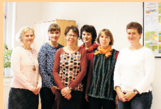
Das Team der Medizinischen Berufsfachschule des Krankenhauses Emmaus Niesky