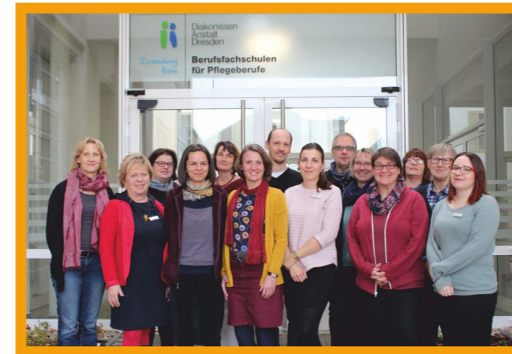
Das Team der Berufsfachschule für Pflegeberufe in Dresden