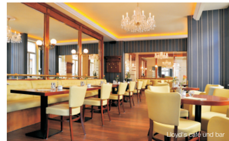
Lloyd's café und bar

In den Weißiger und Pieschener Werkstätten, dem CAP-Markt und dem „Lloyd's café und bar“ wird Menschen mit Behinderung eine Ausbildung oder eine berufliche Tätigkeit innerhalb oder außerhalb der Betriebsstätten angeboten. Dem Wunsch der Beschäftigten nach Teilhabe am Arbeitsleben und anspruchsvollen, gesellschaftlich anerkannten Tätigkeiten versucht die Evangelische Behindertenhilfe Dresden durch diese Angebote nachzukommen.