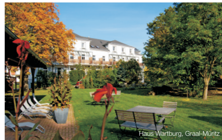
Haus Wartburg, Graal-Müritz

Die Hostienbäckerei wurde im Jahr 1866 von der Diakonissenschwesternschaft ursprünglich für den Eigenbedarf gegründet. Jährlich werden bis zu eine Million Hostien hergestellt und an Kirchengemeinden in ganz Deutschland für die Feier des Heiligen Abendmahls geliefert. Die Hostienbäckerei der Diakonissenanstalt Dresden ist die einzige ihrer Art in Mitteldeutschland.